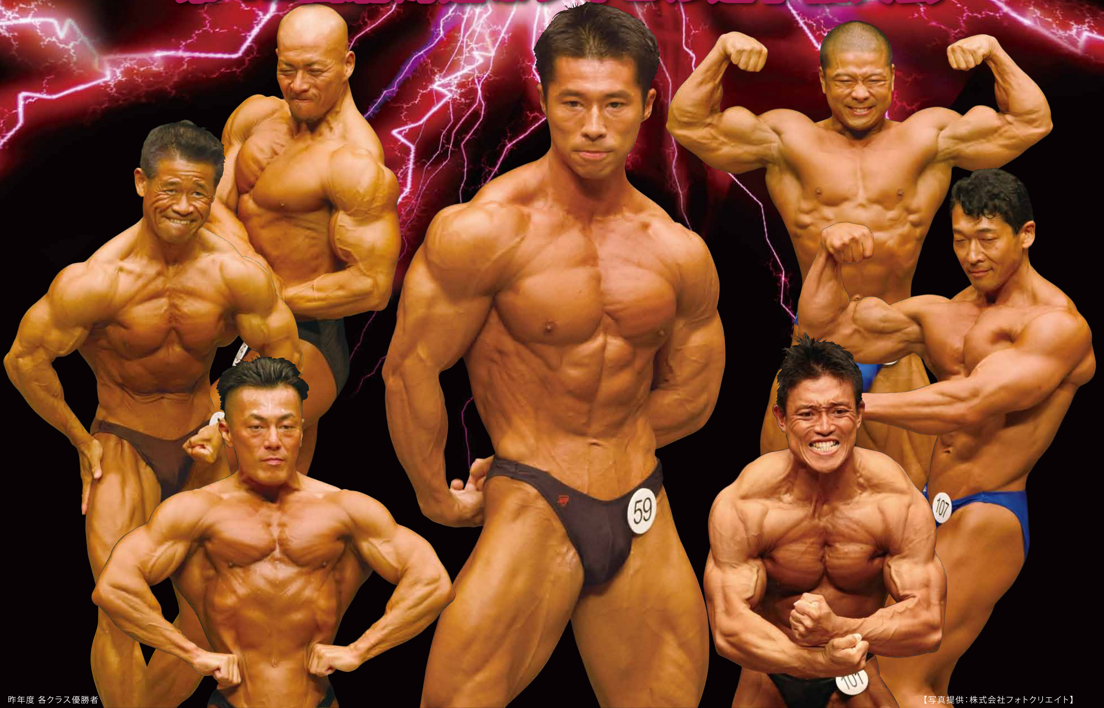
昨年度 各クラス優勝者